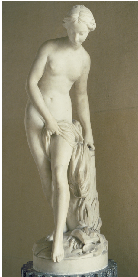
13. La Baigneuse d'Étienne Maurice Falconet (1716-1791) Marbre. H. 0,8 ; L. 0,25 ; Pr. 0,29 m. Musée du Louvre, département des Sculptures, MR 1846