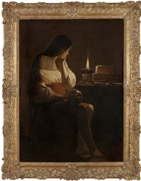
11. La Madeleine à la veilleuse de Georges de La Tour (1593-1652)