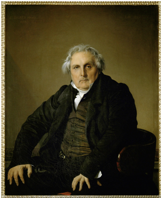
16. Louis-François Bertin de Jean-Auguste- Dominique Ingres (1780-1867) 1832 H. 1,16 ; L. 0,95 m. Musée du Louvre, département des Peintures, RF 1071