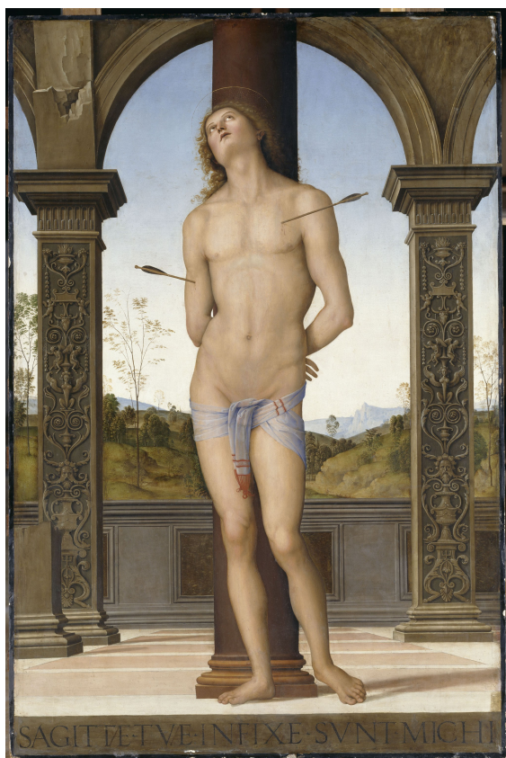
7. Saint Sébastien de Pietro di Cristoforo Vannucci, dit Le Pérugin (1450-1523)