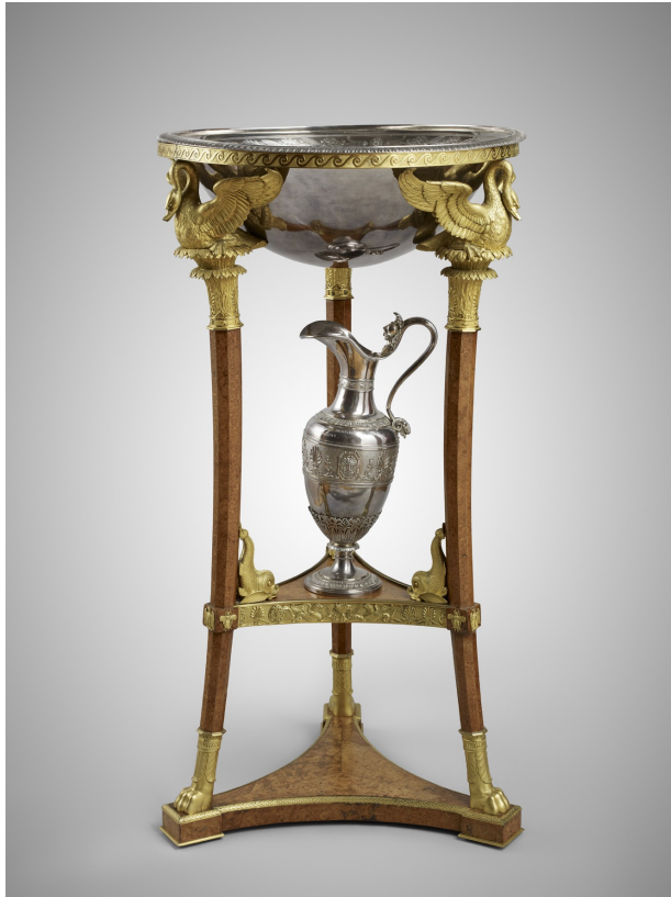
15. Athénienne de Martin-Guillaume Biennais Entre 1800 et 1804 / Fabrication : Paris If, bronze, argent Musée du Louvre, département des Objets d'art, OA 10424