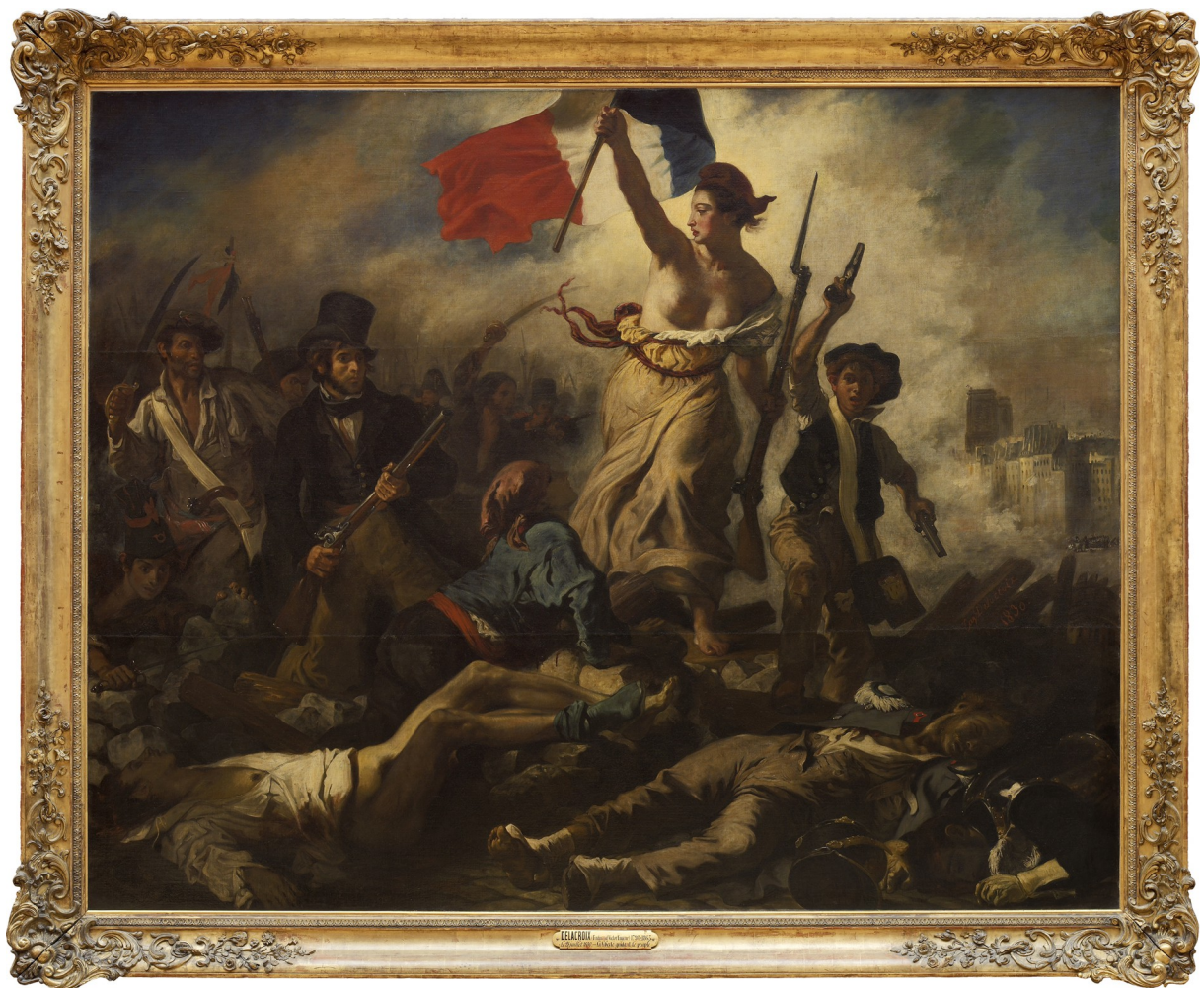
17. Le 28 Juillet. La Liberté guidant le peuple (28 juillet 1830) d'Eugène Delacroix (1798-1863) H. 2,6 ; L. 3,25 m. Musée du Louvre, département des Peintures, RF 129