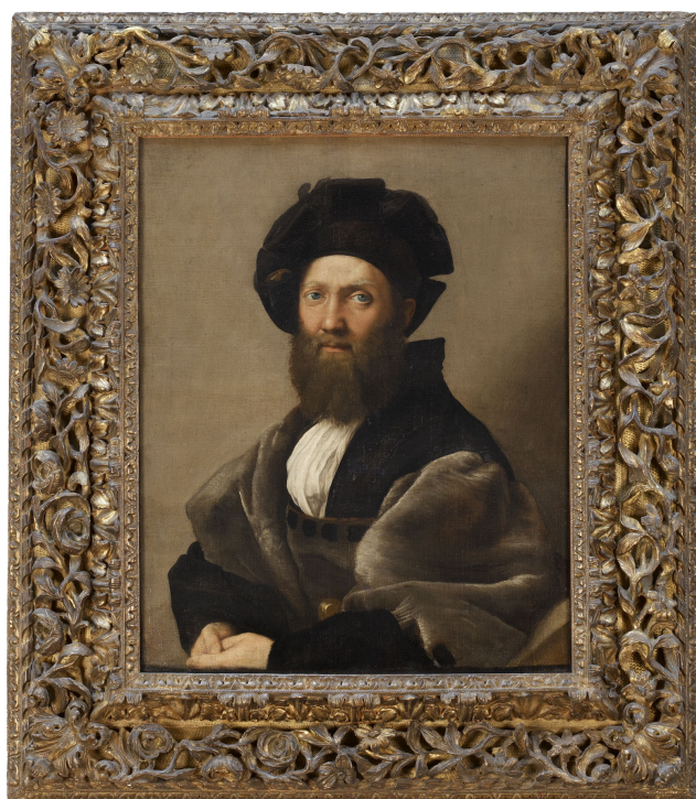
8. Portrait de Baldassare Castiglione, écrivain et diplomate (1478-1529) de Raffaello Santi, dit Raphaël (1483-1520)