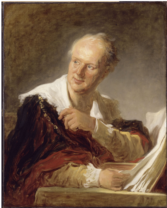
12. Figure de fantaisie, autrefois identifiée à tort comme Denis Diderot , de Jean Honoré Fragonard (1732-1806)