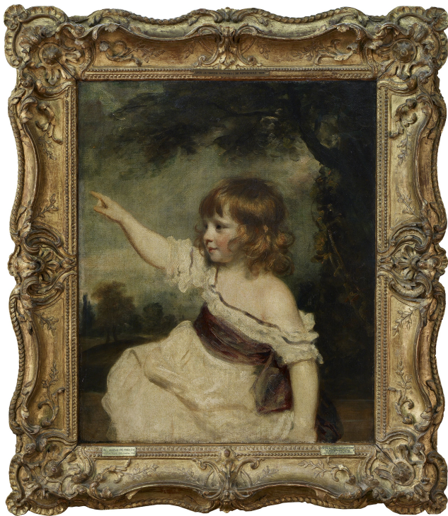
14. Master Hare de sir Joshua Reynolds (1723-1792) H. 0,77 ; L. 0,64 m. Musée du Louvre, département des Peintures, RF 1580