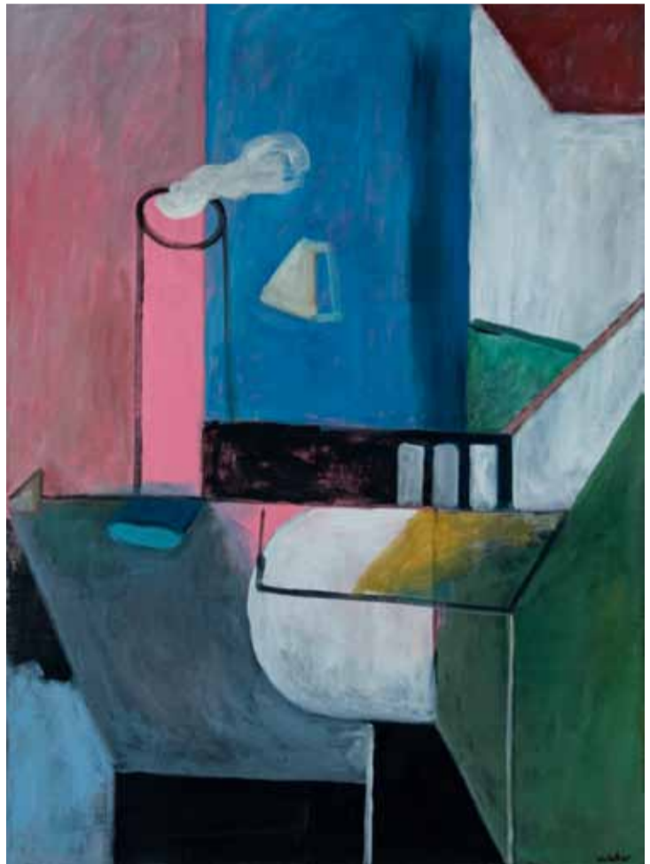
Wo der Schornstein raucht | 2011 | Öl auf Leinwand | 105 x 80 cm © VG Bild-Kunst, Bonn 2016