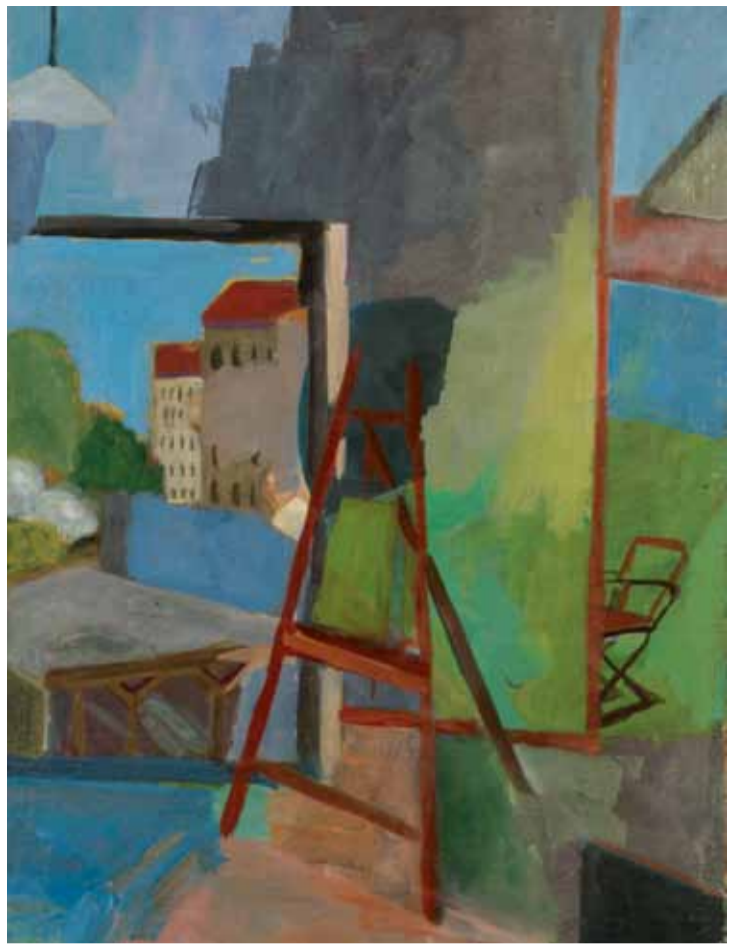
Atelier | 1979 | Öl auf Leinwand | 70 x 50 cm © VG Bild-Kunst, Bonn 2016