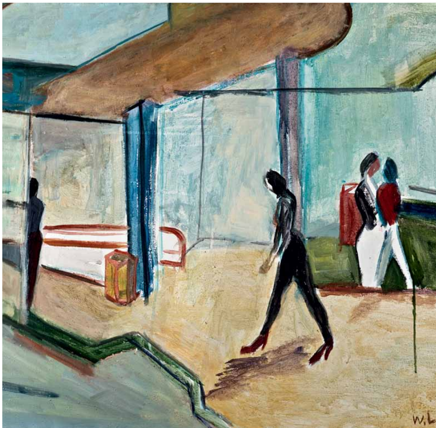
Passanten | 1980 | Öl auf Leinwand | 81 x 100 cm | Sammlung Stadtmuseum Berlin © VG Bild-Kunst, Bonn 2016